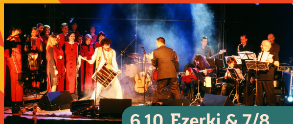
6.10. Ezerki & 7/8

Aktivnosti za sve generacije | Bogati sadržaji za djecu | Gastronomija i Eko Sajmovi